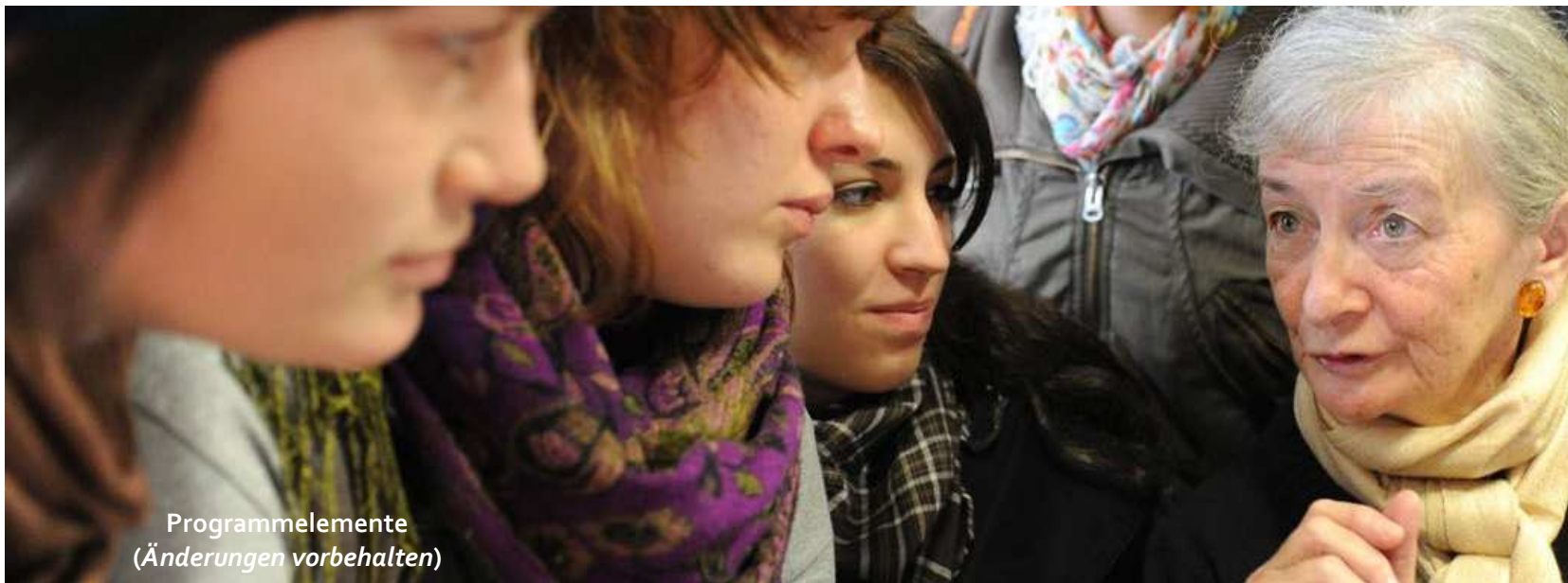
Programmelemente (Änderungen vorbehalten)