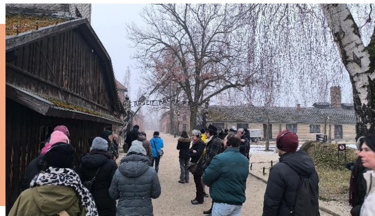
Führung im Stammlager Auschwitz I